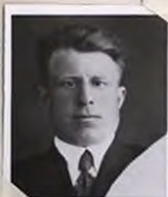
г. Бийск. 1940 г. Пересфотографирован в 1952 г. г. Слабянск-на-Кубани.