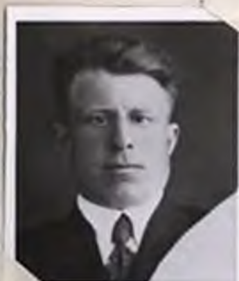
г. Бийск. 1940 г. Пересфотографирован в 1952 г. г. Слабянск-на-Кубани.